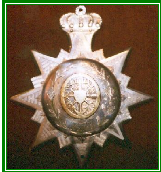
1836 Schützenkönig Richter (Ackersmann)