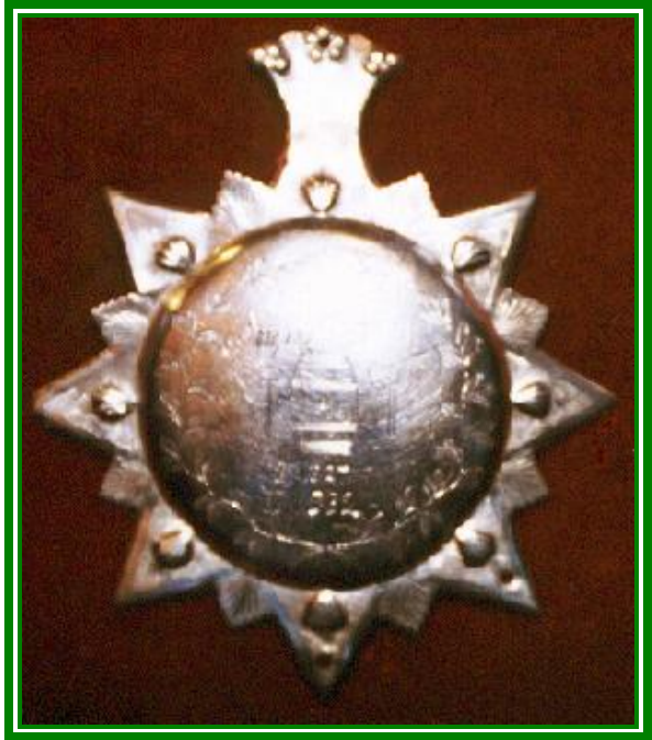
1827 , 1832 und 1848 Schützenkönig Carl August Westphal (Böttcher)