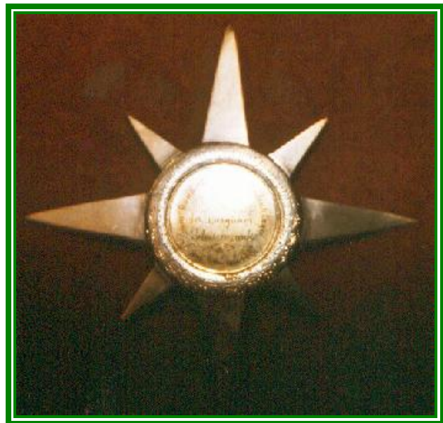
Zum hundertjährigen Gedenktage gewidmet der Darguner Schützenzunft am 5. Juli 1889 Neukalener Schützenzunft