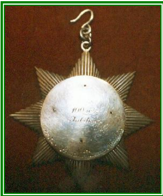
1889 Zum 100 jährigen Jubiläum von der Schützenzunft zu Malchin