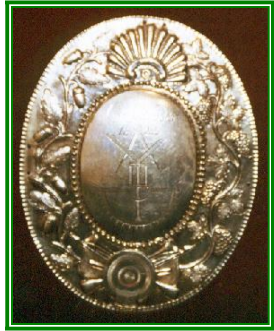
1822 Schützenkönig Carl Schröder (Müllermeister)