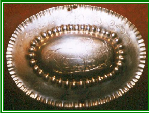
1868 und 1869 Schützenkönig Christoff Penzlin (Ackersmann)